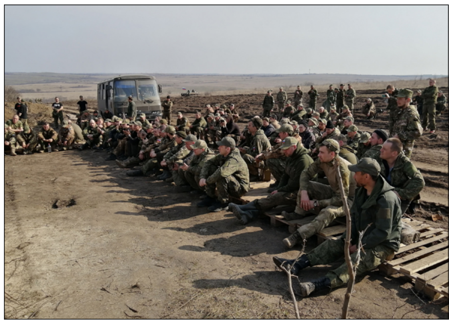
Так слушают только настоящие стихи

Признаться честно, расставаться с бойцами было нелегко, но хочется верить – мы смогли хоть немного восполнить им то родное и далёкое, что ребята оставили дома, и они почувствовали нашу благодарность и огромное уважение за их трудный и опасный, но жизненно необходимый Родине ратный труд.