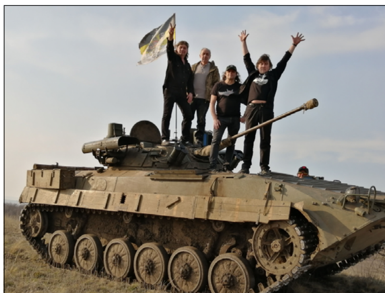
Агитбригада на БМП