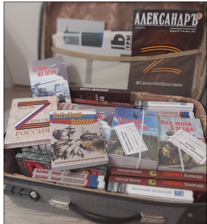
Каждой библиотеке в ДНР и ЛНР по чемодану книг