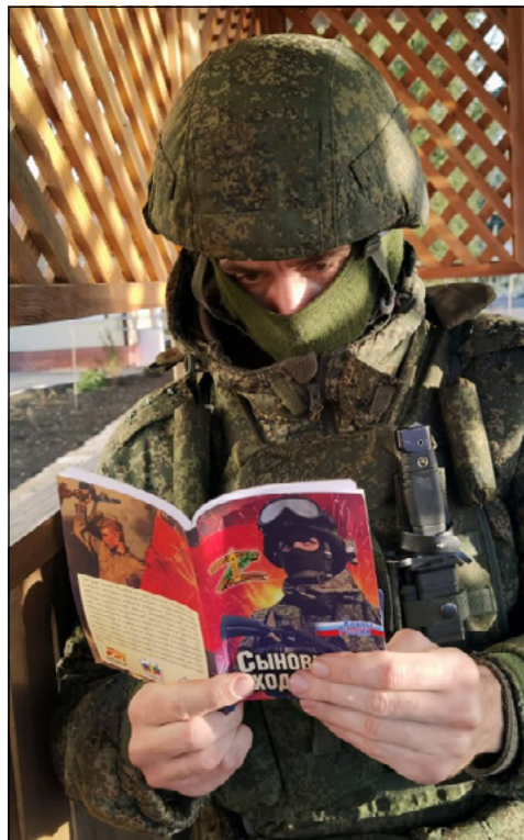
А книги наши – читают!