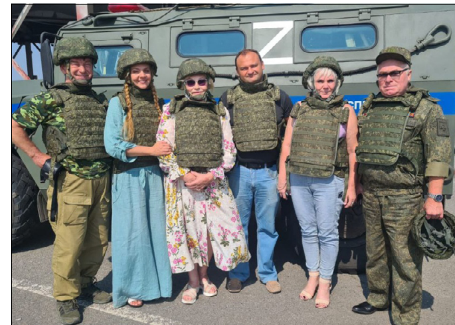
Хмара-бронники. Готовы к труду и обороне