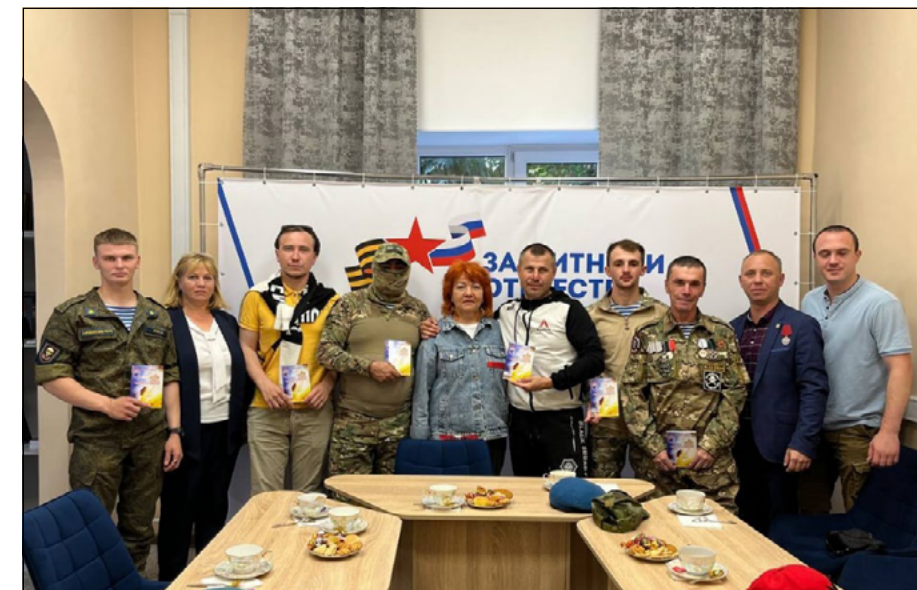
Поэзию – в дар! Рязские поэты и участники Спецоперации