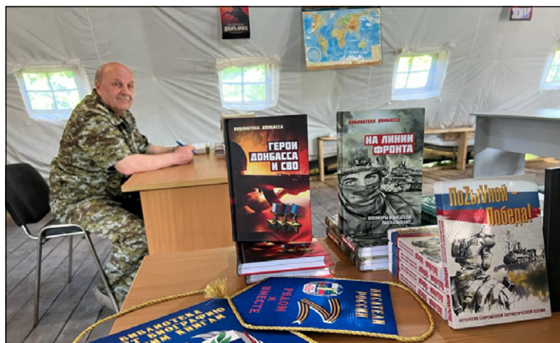
Всё для фронта всё для победы

И, конечно же, мы пожелали лётчикам мирного неба и скорейшей Победы!